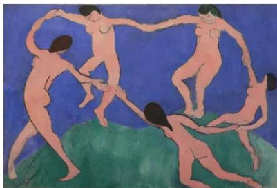
A Dança (1909)

1. Henri Matisse, 1869 – 1954, Le Cateau-Cambrésis, França