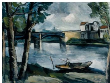
A ponte sobre o rio Sena em Chatou (1908) National Gallery of Victoria, Melbourne

3. Maurice de Vlaminck, 1876 - 1958, Paris, França