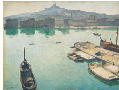
Porto de Marselha (1916)

3. Maurice de Vlaminck, 1876 - 1958, Paris, França