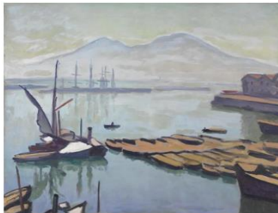
Baía de Nápoles (1908)

2. Albert Marquet, 1875 – 1947, Bordéus, França