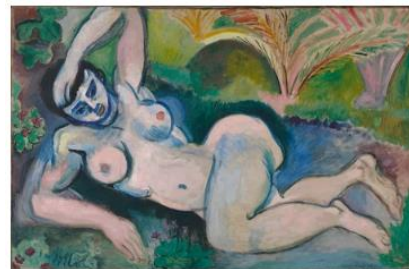
O Nu Azul (1907)

2. Albert Marquet, 1875 – 1947, Bordéus, França